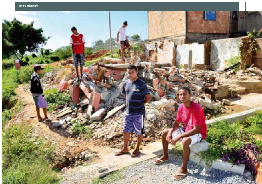
Região do Nacional tem 26 mil pessoas, com 75% desempregados