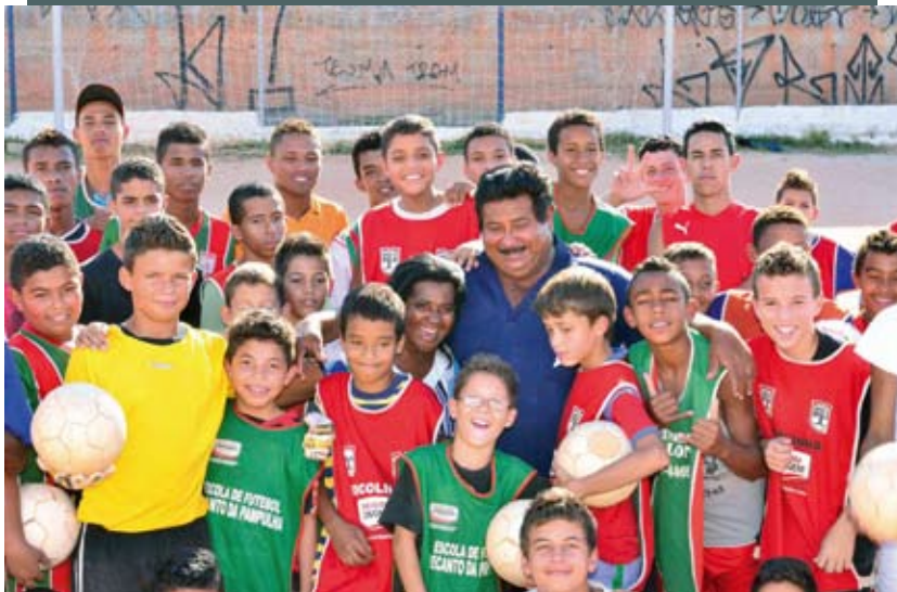
Um dos focos: iniciativas como a escolinha de futebol do Estrela Dalva

periência inédita de cooperação internacional para a promoção de ações que auxiliem na redução da violência que atinge crianças e jovens entre 10 e 24 anos. Por meio do estímulo ao cumprimento voluntário de regras, da autorregulação do comportamento e da promoção de mecanismos de controle social, pretende fortalecer a capacidade dos indivíduos e as condições de governança local para assegurar a sustentabilidade das ações.